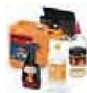
Chauffage, cheminée & barbecue