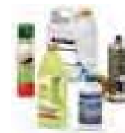
Produits spécifiques de la maison