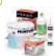
Bricolage & décoration

Ces déchets sont à déposer dans un local spécifique. Adressez-vous au gardien.