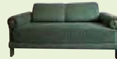
Sièges et rembourrés